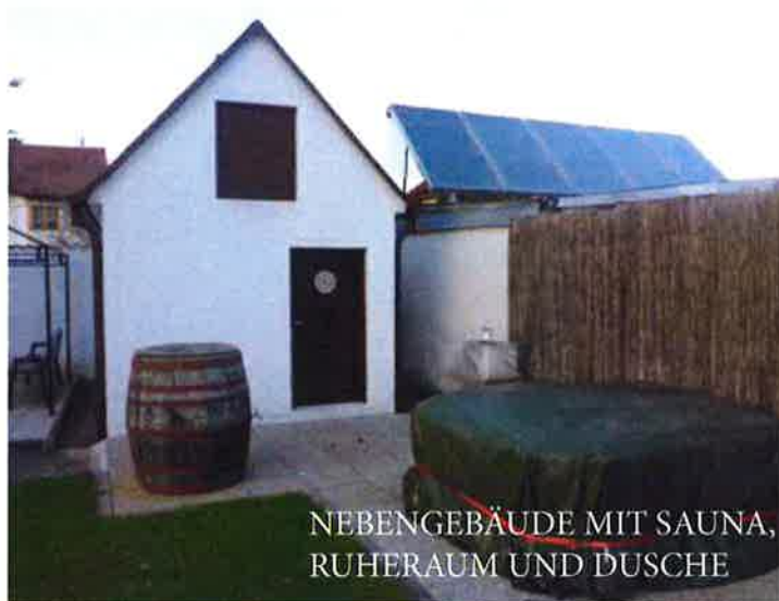
NEBENGEBAUDE MIT SAUNA, RUHERAUM UND DUSCHE